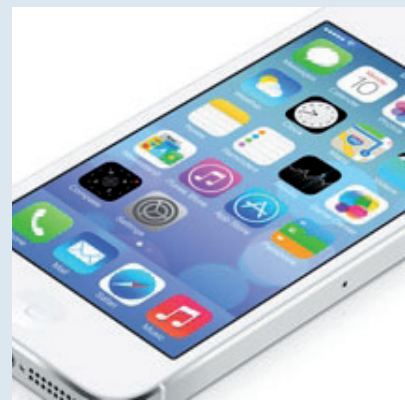
קשובה יותר ללקוחות שלה. מערכת ה-iOS 7 של אפל

דיונים רבים מתקיימים באינטרנט על אודות העיצוב החדש. חלק טוענים, כי מדובר בגאונות עיצובית של אייבי, הממזה את כל עקרונות אפל באופן ברור. אחרים, מנגד,