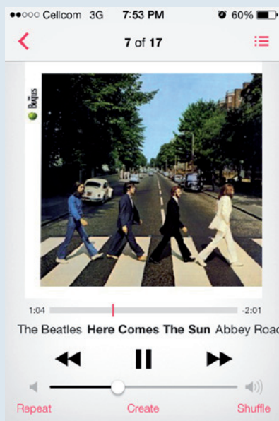
שדרונים מתחת למכסה

אפל הטילה פצצה. מלחמות מתנהלות באינטרנט על העיצוב, הפיצ'רים, גרסת הבטה המאכזבת שרוחקה מאוד מלהיות מושלמת, וכמובן מלחמת האפל-אנדרואיד שכולנו מכירים. אך האם מערכת זו היא ה"אס" שאפל הסתירה בשרוול בחודשים האחרונים, או שמא מדובר בניסיונות נואשים להחיות את ההייפ שהיא רגילה אליו? אכן, יש סיפור ביכולת של אפל להקטיב ללקוחות שלה - סוף סוף ישנן אופציות נוספות לשליטה ותמרון במערכת ובמכשיר עצמו, שניתן לראות בבירור שהן לוקחות השראה בעיקר ממערכת אנדרואיד ומהתקני צד שלישי. אפל מודעת למתחרות שלה ולמה